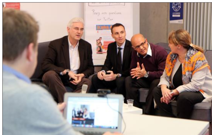
Une vidéo présentant la formation a été mise en ligne.

Le thème du jour est la présentation d'une nouvelle innovation à mettre à l'actif de l'université et de Rhénatic : l'école numérique UHA 4.0, qui entre dans sa dernière phase de recrutement avant la première « rentrée », le 26 janvier. Pour ce faire, ses maîtres d'œuvre ont naturellement choisi une conférence de presse... 4.0. « La retransmission est en direct sur le site de l'UHA et vous pouvez poser vos questions sur Twitter ! », précise l'animateur.