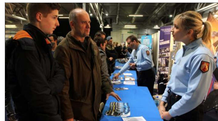
Au pôle Armée, beaucoup de questions sur les attentats.

Entendu hier matin au pôle Média, de la part d'un candidat de 45 ans, prêt à reprendre des études de journalisme pour... bien gagner sa vie !