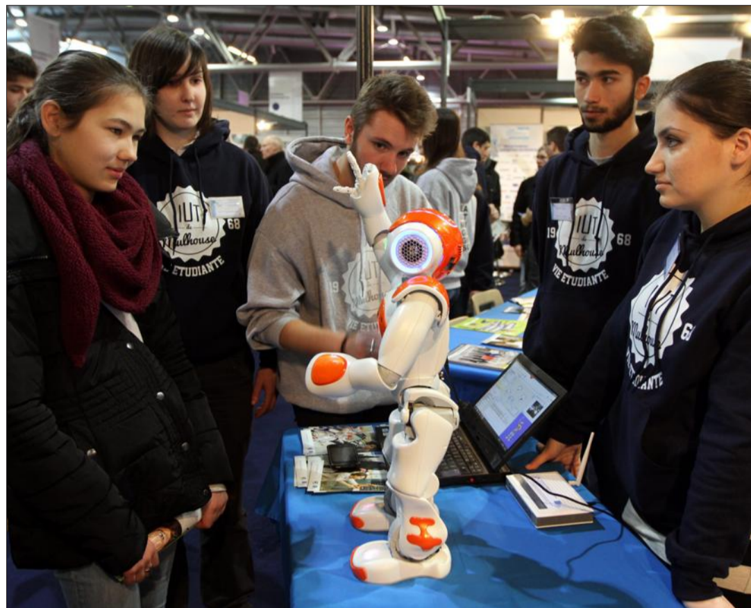
La Journée des carrières au Parc des expositions a permis à de nombreux collégiens et lycéens de découvrir Nao le robot, mais surtout le DUT Génie électrique et informatique industrielle de Mulhouse.

ADULTE.- Quand il y a trois ans les organisateurs de la Journée des carrières et des formations de Mulhouse avaient lancé un espace adulte, le succès avait été, disons... modéré. Trois ans plus tard, c'est une belle réussite, avec un espace de plus en plus développé, une affluence grandissante... Certes, des parents d'élèves y ont probablement passé du temps pendant que leur lycéen ou collégien parlait chercher sa voie dans le Parc-Expo, mais la pertinence d'un espace pour aider un salarié