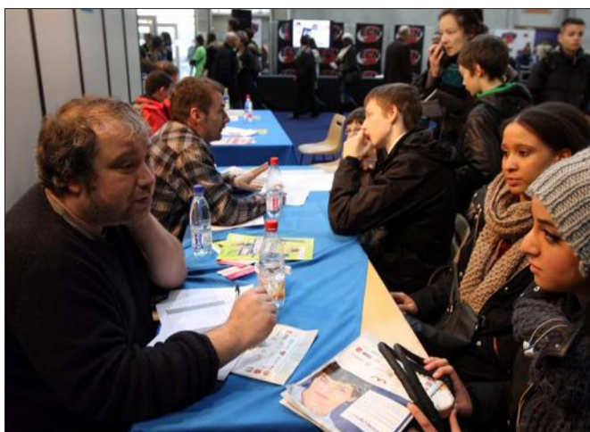
Le pôle Information et communication pris d'assaut par des candidats aux métiers du journalisme.